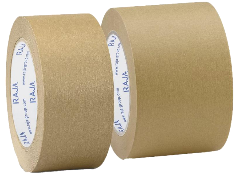
Packband aus Papier