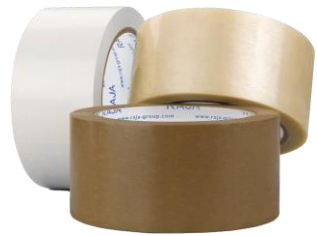
Packband aus PVC