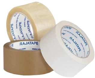
Packband aus PP